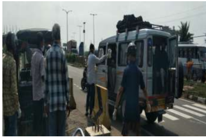
At -Lanjipalli Bye Pass Road (NH-16)