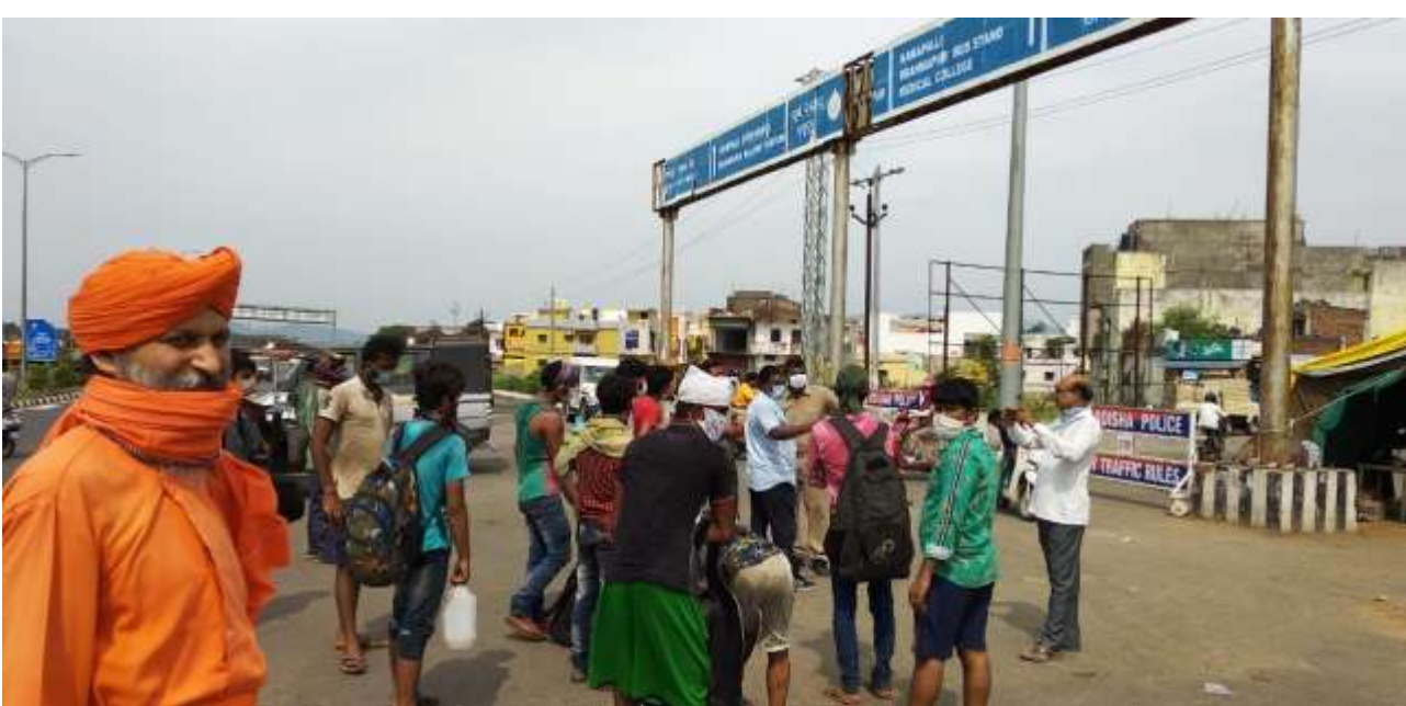
Transport service facilitate by the volunteers