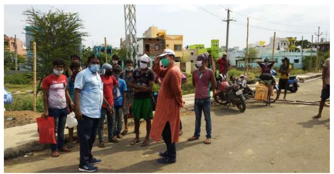
Guidence -- Provide Transport facilitate for Migrant Labourers (NH-16)