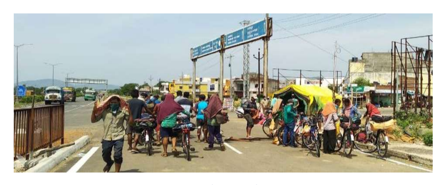
Arrangement of Transport facilities