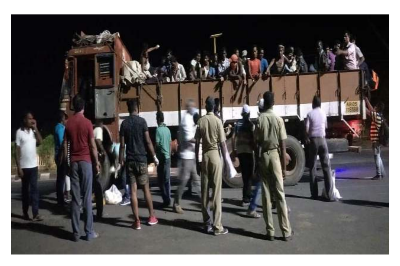
Relief Service Provided at NH-16 on Night 9 'clock