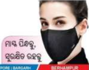
ମାସ ପିନ୍ଧିବୁ, ସୁରକ୍ଷିତ ରହୁବୁ