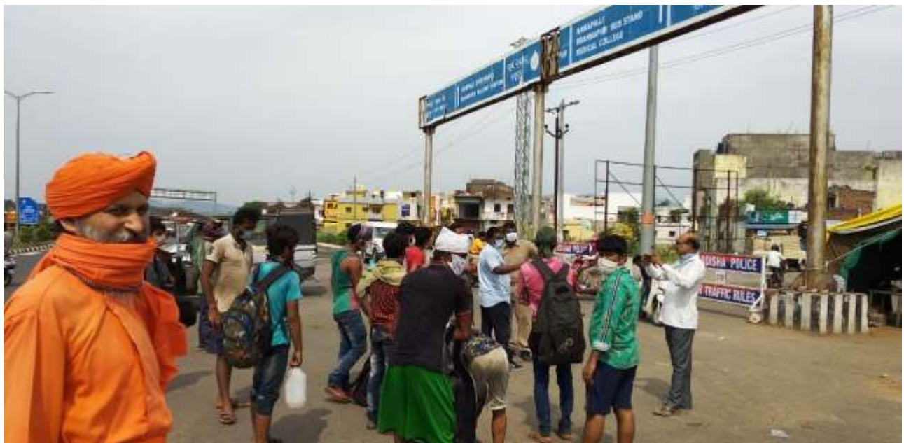
Transport service facilitate by the volunteers