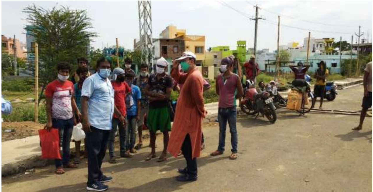
Guidence -- Provide Transport facilitate for Migrant Labourers (NH-16)