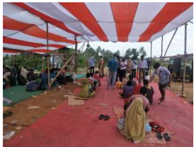
Beside Golanthara Police Station