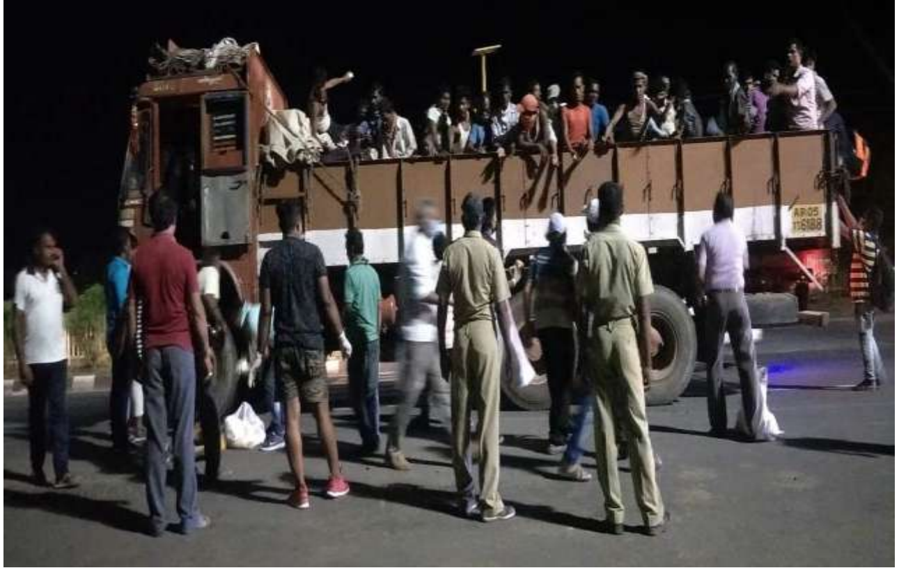
Relief Service Provided at NH-16 on Night 9 'clock