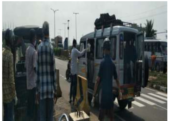
At- Lanjipalli BYE Pass (NH-16)