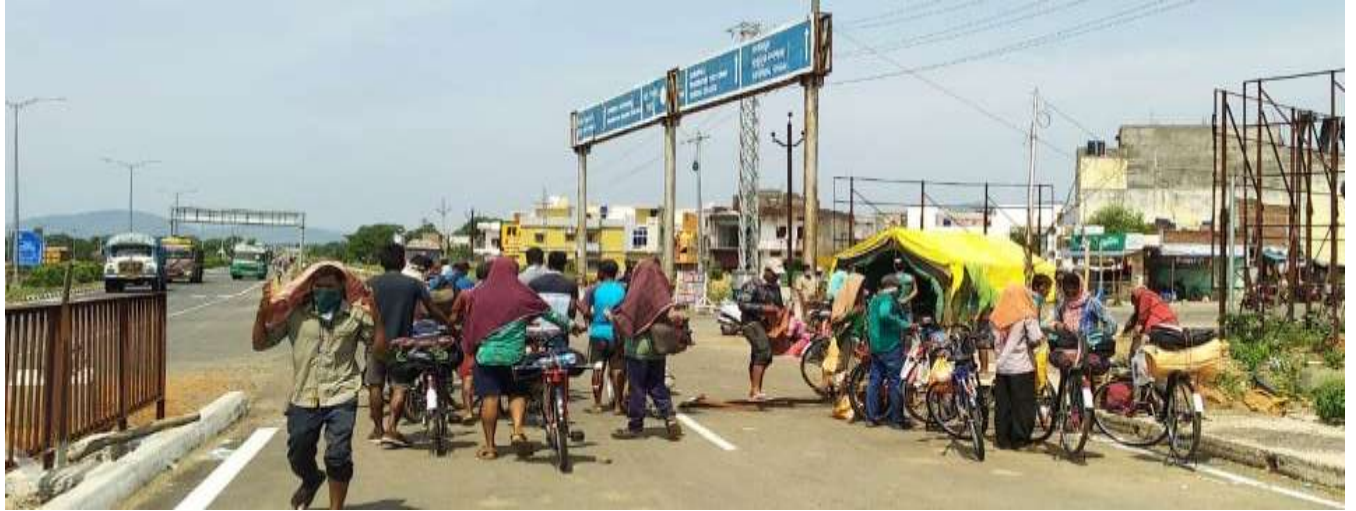
Arrangement of Transport facilities