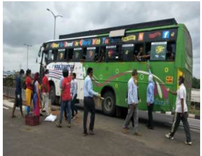
Mask Distributed to Migrant labours